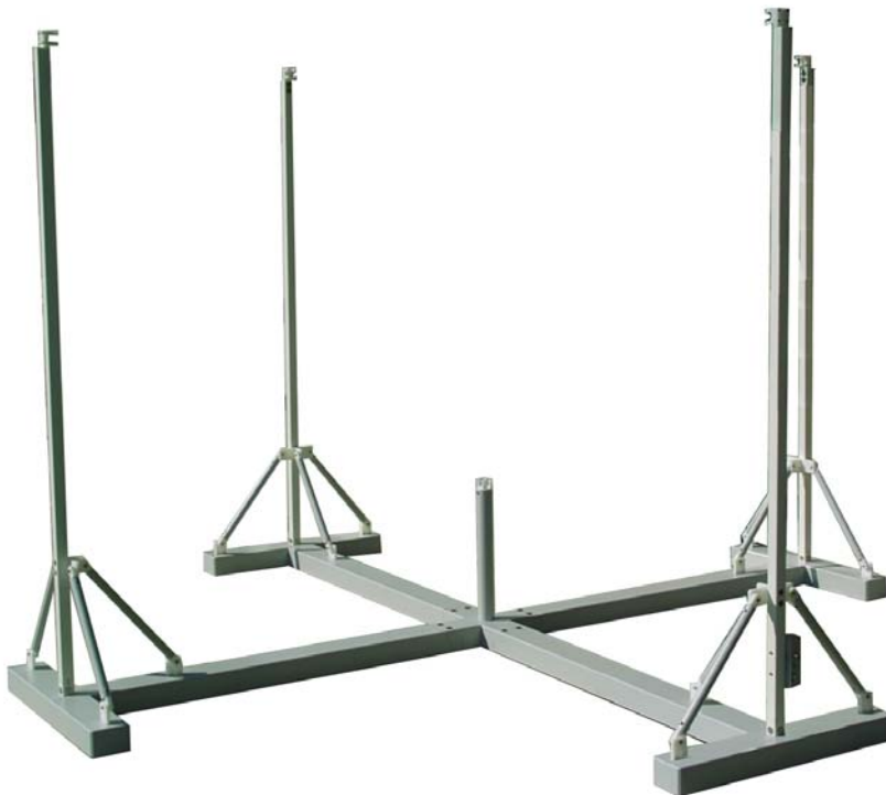
Bild 6: Fertig montierter Standfuß Fig. 6: Completely assembled support stand