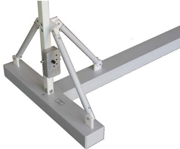
Bild 3: T-förmiger Standfuß mit vertikaler Stütze, Streben und Koaxialumschalter (S1, Blick von oben) Fig. 3: T-shaped stand with vertical loop bearing and coaxial switching unit (S1, view from above)