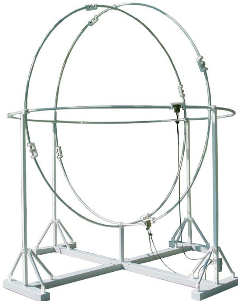
Bild 13: Standfuß mit 3 Ringen und Verkabelung Fig. 13: Support stand with 3 rings and coaxial cables

The horizontal ring X is prepared as described in step 3, but not closed. It is guided outside the other rings at the stand bearings S1 and S2 and inside the other rings at stands S3 and S4, with the current transformer being close (20 cm) to bearing S1. After the correct routing of the ring has been verified, it can be closed and the connection bars can be tightened. Then the ring can be elevated and snapped into the corresponding clamps. The missing clamps are added to complete the mounting of the rings.