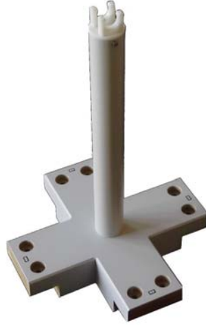
Bild 5: Kreuzförmiges Mittelstück mit kurzer vertikaler Stütze (Markierungen C1-C4) Fig. 5: Center Cross with short vertical bearing (labels C1-C4)