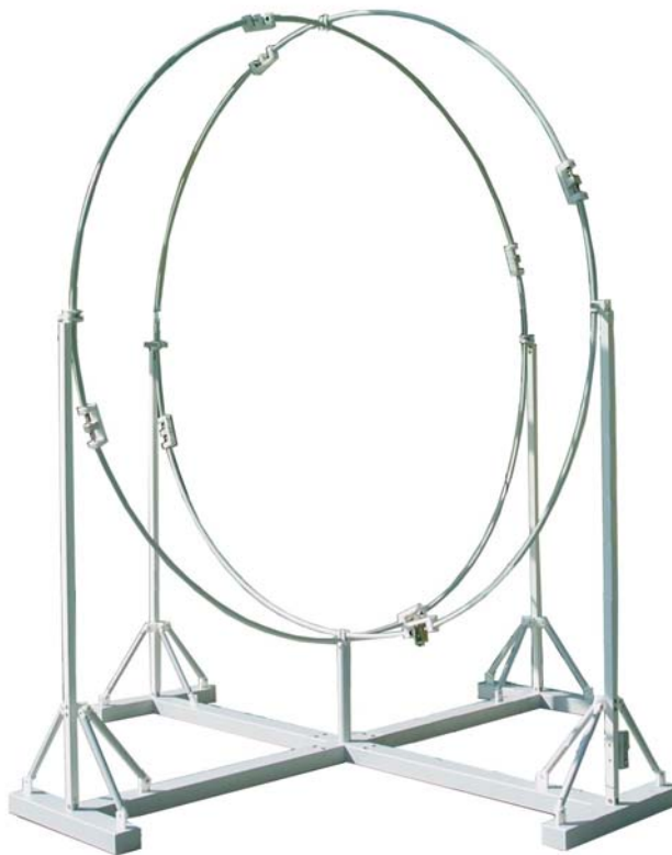
Bild 12: Standfuß mit zwei vertikalen Ringen Fig. 12: Support stand with two vertical rings

Step 4: Mounting the second vertical ring (YA-YD) at the stand (above S1 and S3) In general the mounting of the second ring is similar to the first, but the closing of the ring is made after pushing the second ring through the first one. This ensures that ring Y is above ring Z at the bottom and top connection points and therefore all rings have the same diameter. After having closed the ring and tightening the connections, the ring can be erected and put into the correct location. The current transformer of the second ring must be close to the central stand bearing (recommended spacing: 20 cm), facing towards the coaxial switching unit at S1. The ring can be snapped into the clamp at the central support bearing and at the vertical stand bearing above S3. At the opposite side (S1) the ring is only guided loosely and will be fixed later. 4 clamps with screws M3 x 40 are used to connect the loops Y and Z at the topmost crossing point.