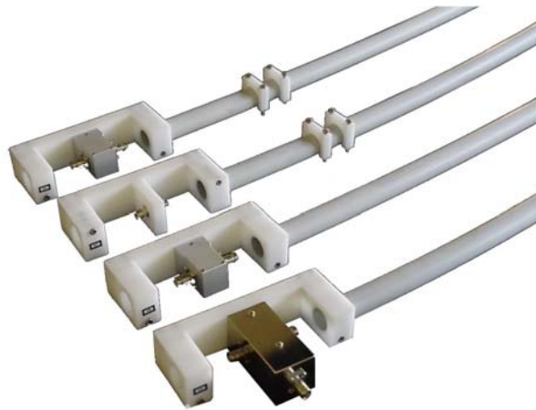
Bild 10: Bestandteile eines Rings mit Hüllrohren (ohne Kabel) Fig. 10: Parts of a loop ring with cladding tubes (without cables)