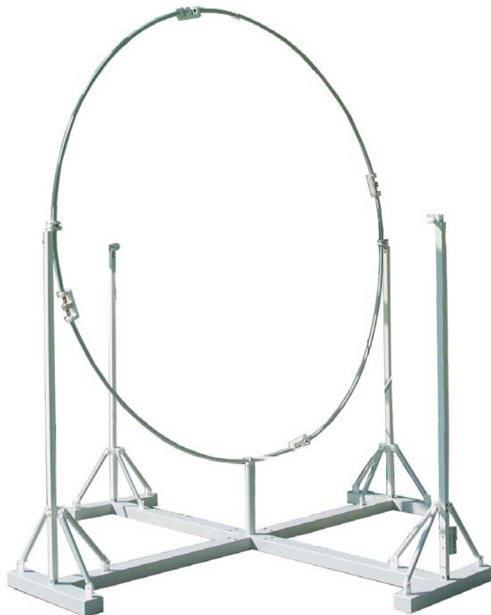
Bild 11: Standfuß mit einem vertikalen Ring Fig. 11: Support stand with first vertical ring

Step 3: Mounting the first vertical ring (ZA-ZD) at the stand (above S2 and S4). Two persons pick up the ring from the ground, each of them standing close to the slits with the current transformer facing down and the through section facing up. The current transformer of the first vertical ring should be located close to the center cross of the stand (recommended spacing: 20 cm). As soon as the ring is placed at the correct position the ring can be snapped into the central fixture of the stand. The ring must also be snapped into the clamp of the vertical stand bearing S4. The opposite stand bearing S2 is only used to guide the ring loosely. The ring will be fixed later after the other rings have been placed.