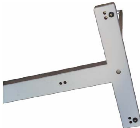
Bild 2: T-förmiger Standfuß (Blick von unten) Fig. 2: T-shaped stand part (view from below)

The center cross and the T-shaped stands are labelled with C1-C4. The complete stand consists of 4 T-shaped stands and the center cross, which are connected with 8 screws M10 x 80, washers and nuts. It is very essential to avoid mechanical stress to the center cross during assembly and movement of the loop stand because of the long lever arms of the T-shaped stands. The above is important for both, lifting and moving the stand. Ignoring this may damage the center cross or the T-shaped stands. If lifting or moving of the complete stand is required, four persons are recommended, who handle the T-shaped parts near their centers of gravity.