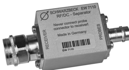
Einspeiseweiche: EW 7110 AC/DC separator: EW 7110