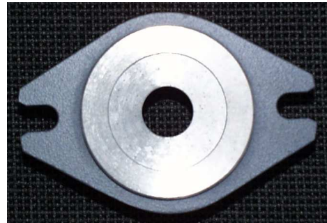
Fig. 2: Rohde & Schwarz antenna flange