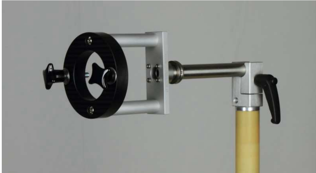
Fig. 1: R&S Adapter RS 9214 fixed on AM 9144 with AA 9202