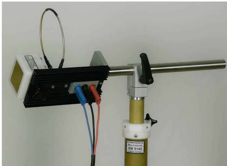
Bild 5: Unterseite des BBV 9721 mit Spannungsversorgungsanschlüssen Figure 5: bottom side of BBV 9721 with power supply jacks