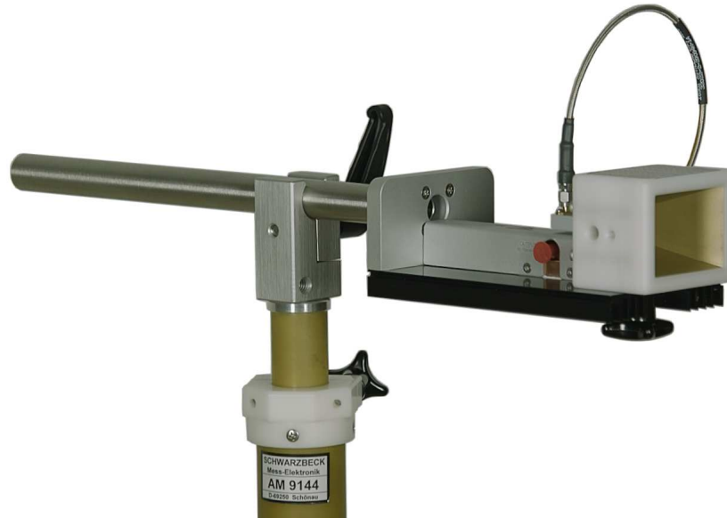
Bild 1: Vorverstärker BBV 9721 mit Hornantenne BBHA 9170 befestigt mit Adapter AA 9202 auf Stativ AM 9144 Figure 1: Preamp BBV 9721 with horn antenna BBHA 9170 fixed with the adapter AA 9202 on the tripod AM 9144